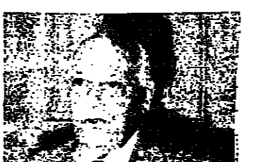
قصر يدي بتصريحه

الحبوب للواجن والحيوانات مما يشكل خسارة كبيرة على الدولة . فكلوا القمح الذي يزرع في الدولة . ٥٠ قرنا بياع في السوق السوداء ٣١٨ . وتشكر الله ان استطاعتنا قدر الامكان ضبط هذه الامور الى ان . نعمل المستقبل وتحول تصحيح الامور في الامكن . واضاف . كذلك هناك قضية المحروقات . فكما تعلمون هناك بعض النقص في السوق لبعض مشتقات المحروقات . لكن هذا النقص لا يمكن اعتباره جديا . لان الناس يجلبون في بعض الاحيان الى التموين اكثر من حاجتهم . وانما نحاول معالجة هذا الموضوع بطريقة تمكن من خلالها تأمين المحروقات الضرورية والتموين اللازم . لكن هناك كميات تذهب الى الخارج . اضافة الى الهدر . وهذا الامر لا يمكن للدولة معالجته في ظرف الزمن . فقط حلجات البلاد نحن على استعداد لتأمينها في اخر درجة ونأمل ان تساعدنا الحال الامور على ما معالجة هذه الامور التموينية في هذه . ثم الذي للرئيس الجميل السيد نجيب ابو حيدر ورئيس معه الاوضاع الادارة واستعمال القمح وبعض انواع الزراعة